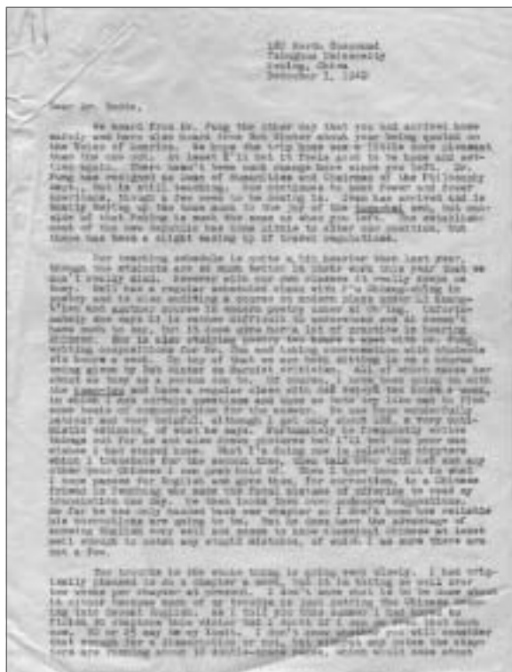
李克致卜德的信件

李克曾在信中對錢鍾書有具體評價，與他確實有過交往。但在目前已見的錢鍾書的回憶文字裏，特別是楊絳的回憶中，從沒有提到過李克夫夫婦，可以反證清華間諜案對錢氏夫婦內心造成的恐懼。